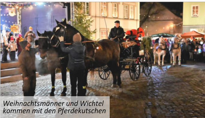
Weihnachtsmänner und Wichtel kommen mit den Pferdeutschen