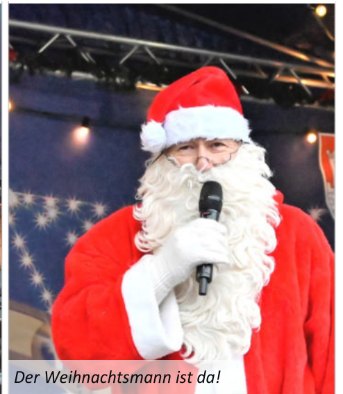
Der Weihnachtsmann ist da!