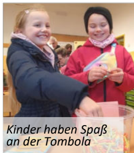
Kinder haben Spaß an der Tombola

In unserem Hort ist für die kommenden Wochen noch viel Großes geplant: Plätzchen backen, basteln, die Teilnahme am Sternemarsch in Löbnitz, ein Weihnachtsevent im Fundora in Schneeberg und natürlich die