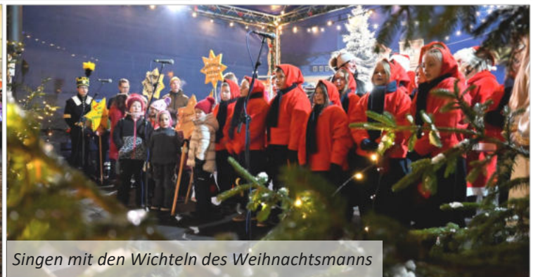
Singen mit den Wichteln des Weihnachtsmanns