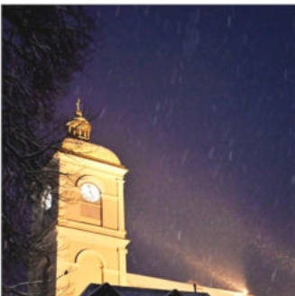
St. Johanniskirche am Abend