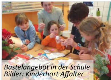
Bastelangebot in der Schule

Affalter stattfinden. Die „Dorfstrolche“ präsentierten sich mit der traditionellen Bastelstraße und einer großen Tombola am bunten Geschehen. Es herrschte großer