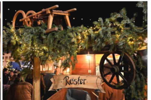
Allerlei hübsch dekorierte Verkaufsstände