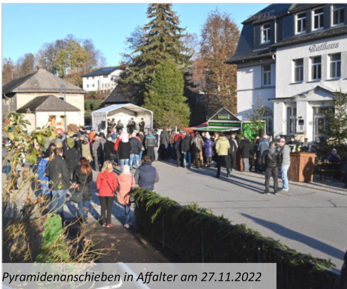
Pyramidenanschieben in Affalter am 27.11.2022

Für die letzten Tage des Jahres wünsche ich Ihnen besinnliche Stunden mit der Familie und den Freunden.