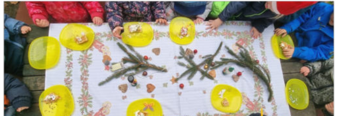
Waffelessen zum kleinen Weihnachtsmarkt der Naturgruppe Bilder: Kindervilla Pustebume

Jeden Tag haben sie sich ein bisschen mehr eingerichtet. Jetzt sind sie nachts bei uns im Haus unterwegs und treiben allerlei Schabernack.