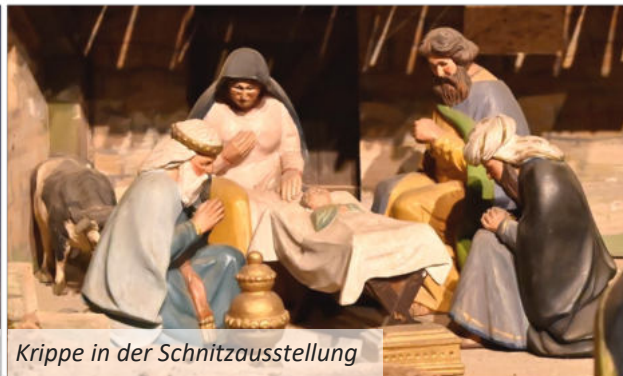
Krippe in der Schnitzausstellung