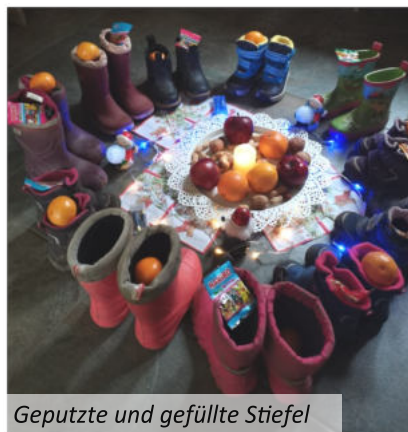
Geputzte und gefüllte Stiefel

Jeden Tag haben sie sich ein bisschen mehr eingerichtet. Jetzt sind sie nachts bei uns im Haus unterwegs und treiben allerlei Schabernack.