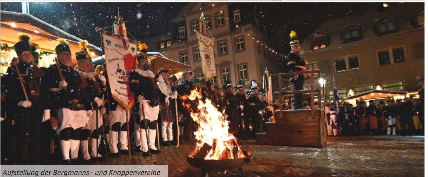
Aufstellung der Bergmanns- und Knappenvereine