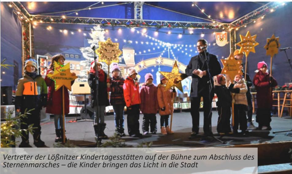
Vertreter der Löbnitzer Kindertagesstätten auf der Bühne zum Abschluss des Sternmarsches – die Kinder bringen das Licht in die Stadt